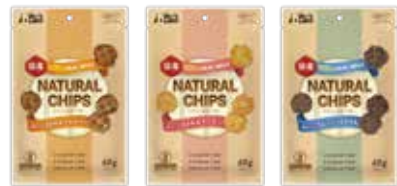
ささみ & ラムレバー ささみ & サーモン ラムハーツ & ささみ