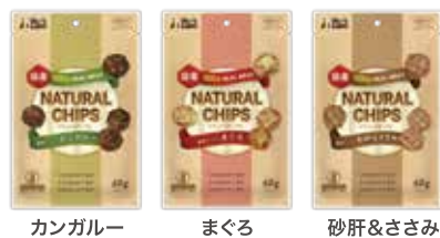
カンガルー まぐろ 砂肝&ささみ