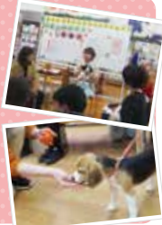
*パピーパーティの様子

いろいろなモノに接したり、触れさせたりしながら、様々な環境や刺激に馴らしていくことを社会化といいます。社会化を適切に行うことにより、社交性が身につく、吠え癖や咬み癖の予防に繋がります。パピーパーティでは、仔犬たちが快適な生活を送るために必要な社会化を、仔犬も飼い主様と一緒に楽しく学んでいます。