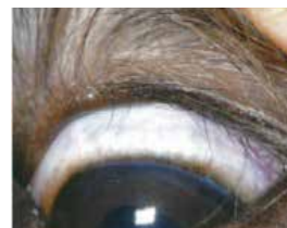
異所性睫毛(まつげの異常)(図2)