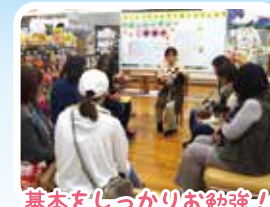
基本をしっかりお勉強!