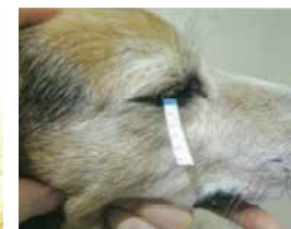
シルマー検査：涙の量を測定(図4)