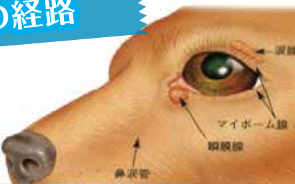
出典 眼の治療マニュアル 千寿製薬会社