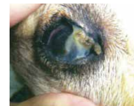
重度の乾性角結膜炎(図3)

ドライアイは人だけでなく、動物にも起こります。一般的にネコちゃんよりもワンちゃんに多いとされており、その中でも特にパグやシーズーといった短頭種で見かけられます。症状としては、眼の乾きや、ねっとりとした目やにが認められ、時に痛みを伴うことがあります。診断には涙の量を測定する検査を行います。治療は長期にわたる点眼治療が必要です。