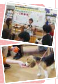
*パピーパーティの様子

いろいろなモノに接したり、触れさせたりしながら、様々な環境や刺激に馴らしていくことを社会化といいます。社会化を適切に行うことにより、社交性が身につく、吠え癖や噛み癖の予防に繋がります。犬自身のストレス軽減にもなります。パピーパーティでは、仔犬たちが快適な生活を送るために必要な社会化を、仔犬も飼い主様と一緒に楽しく学んでいきます。