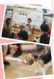
*パピーパーティの様子

いろいろなモノに接したり、触れさせたりしながら、様々な環境や刺激に馴らしていくことを社会化といいます。社会化を適切に行うことにより、社交性が身につく、吠え癖や噛み癖の予防に繋がります。犬自身のストレス軽減にもなります。パピーパーティでは、仔犬たちが快適な生活を送るために必要な社会化を、仔犬も飼い主様と一緒に楽しく学んでいきます。