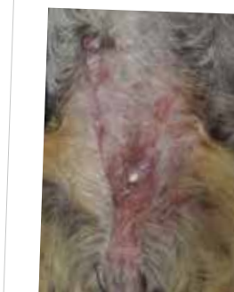
乳腺部分が炎症で赤く、棒状～板状の硬い腫瘍となっています

外科手術をしてはいけない乳腺腫瘍です。腫瘍の大きくなるスピードがとても早く、赤みや浮腫、熱感も伴います。本人も痛みを感じます。