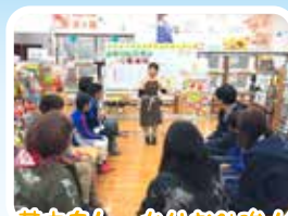
基本をしっかりお勉強!