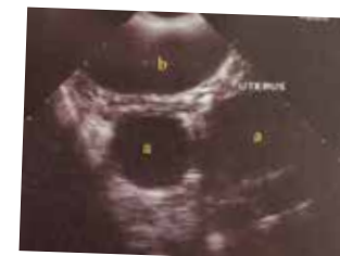
エコー検査で子宮の拡張が見られます a; 拡張した子宮 b; 膀胱