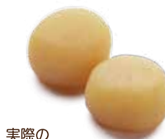
実際の メディボール