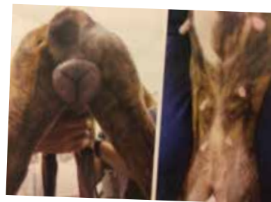
発情が長期間続いた卵胞嚢腫の子です 右：乳頭が腫れて目立っています 左：陰部が大分腫れています

主に未経産犬で見られ、猫ではまれな病気です。良性腫瘍（卵巣腺腫）と悪性腫瘍（卵巣腺癌）があり、避妊手術でたまたま見つかることもあれば、腫瘍が大きくなってから気づかれることもあります。片側だけのことが多いですが、両側にできることも少なくありません。