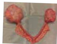
卵巣腫瘍では、卵巣が腫れて嚢胞状になっています