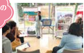
歯磨きの重要さをお勉強!