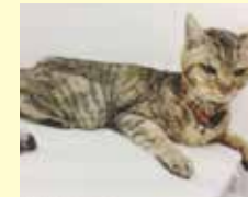
甲状腺機能亢進症のネコ