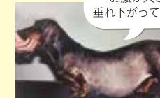
副腎皮質機能亢進症の犬

副腎から分泌されるステロイドホルモンであるコルチゾール量を測定します。ホルモンが過剰である場合と不足する場合で症状が異なりますが、そのまま放置すると命に関わる状態につながることもあります。