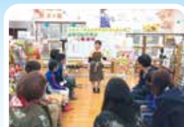
基本をしっかりお勉強!