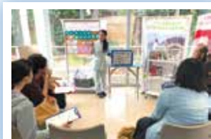
歯磨きの重要さをお勉強!