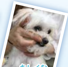
キレイな歯を目指そう!