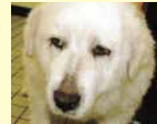
甲状腺機能低下症の犬

甲状腺から分泌されるホルモン量を測定します。甲状腺ホルモンの過不足で生じる病気の発見に役立ちます。ワンちゃんでは甲状腺機能低下症(動きが鈍い、体重が増えてきた、悲しそうな顔に見える)、ネコちゃんでは甲状腺機能亢進症(食べるのに痩せる、攻撃的になる、毛がバサバサになる)が多いです。